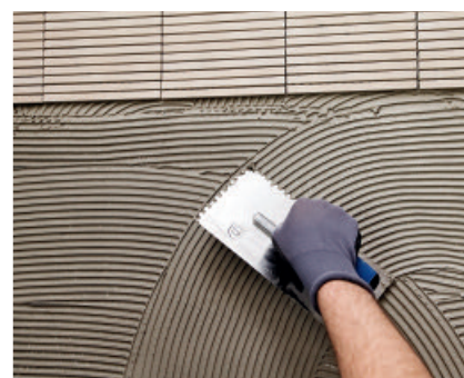
PCI Flexmörtel S1 Rapid passer særlig godt ved arbeid under tidspress.