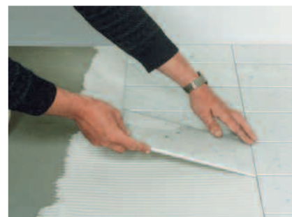
PCI Carraflex for brukervennlig legging av fliser av naturstein og marmor.